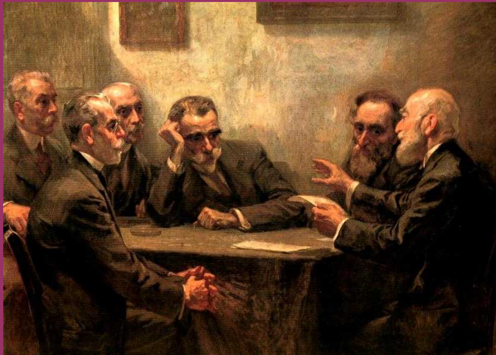
Γεώργιος Ροΐλός, Οι παρνασσιιστές ποιητές