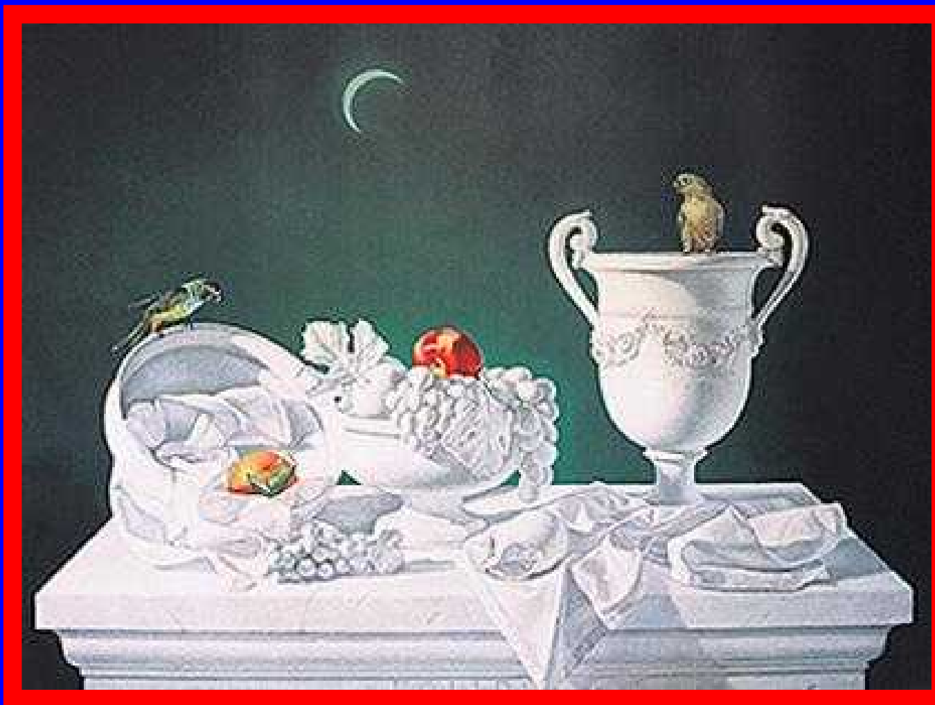
Αχιλλέας Δρούγκας, Τίτλο